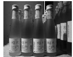
木内酒造で試飲&お買い物