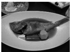
海の幸を堪能しました

ダイナミックで変化に富んだ五浦の景観が目の前に広がる大広間で、地元・木内酒造の地ビールとお酒をいただきながら、海の幸いっぱい昼食。ここでは、皆様のパワーの源が“アルコール”であることが判明・・・。